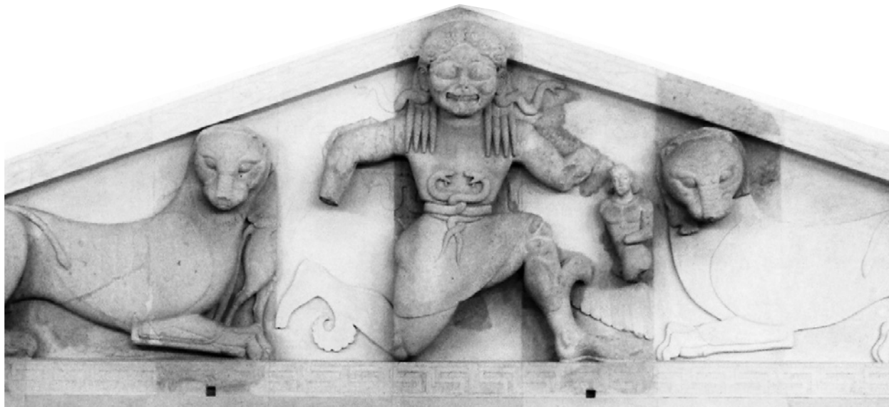
Gorgone, frontone del Tempio di Artemide, Museo di Corfù, Grecia.