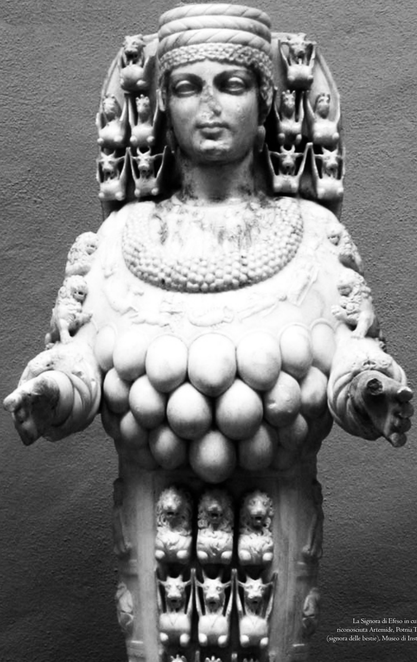
La Signora di Efeso in cui viene riconosciuta Artemide, Potnia Theròn (signora delle bestie), Museo di Istanbul.