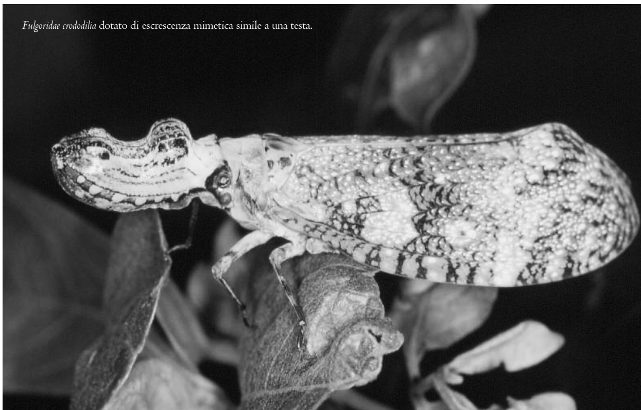
Fulgoridae crocodilia dotato di escrescenza mimetica simile a una testa.

L'opera (ed. or., Medusa et C ie , Éditions Gallimard, 1960 Paris) si apre con una nota metodologica. L'intera questione del mimetismo è affrontata per sviscerare la questione dell'antropomorfismo: l'intento viene chiarito in apertura, e il primo problema che l'autore nota a proposito della letteratura sul mimetismo deriverebbe dalla lettura di un fenomeno naturale attraverso fallacie interpretative antropocentriche.